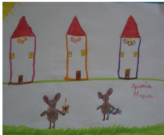
4 η ΟΜΑΔΑ