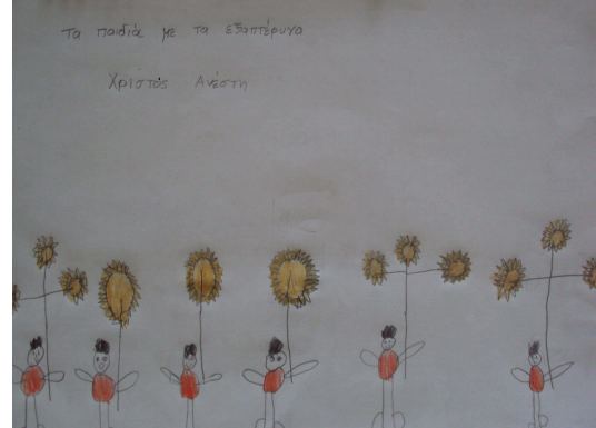
2 η ΟΜΑΔΑ