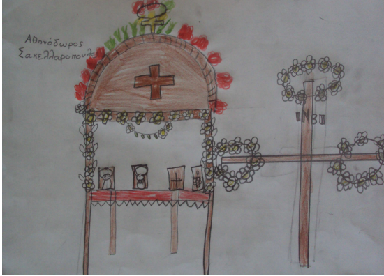
1 η ΟΜΑΔΑ